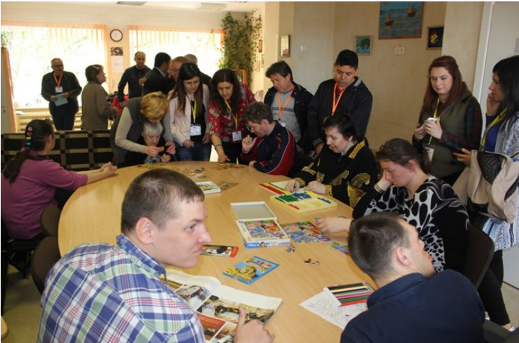
Pilsetas Domes Socialo Lietu Parvaldes