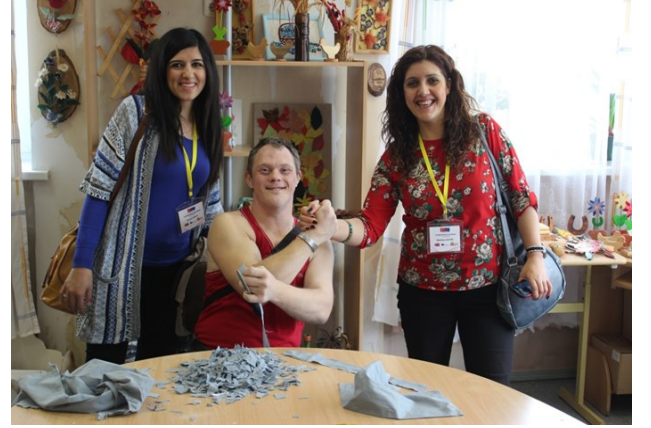
Speciala Pamatskola ( Ş Okulu)