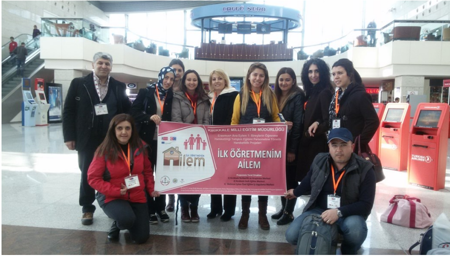
Detsk Domov Klanovic, Zihin Engelli Bireyler Rehabilitasyon Merkezi

22.Mart / 4.Nisan 2015 Tarihleri arasında ilk hareketliliğimizin gerçekleştiği Çek Cumhuriyetinin Prag şehrinde öğretmenlerimiz engelli bireylere eğitim imkanı sağlayan kurumlarını ziyaret etme imkanı buldular.