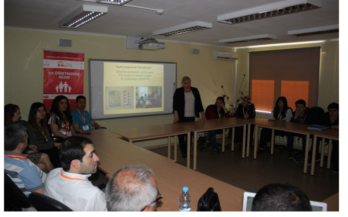
Daugavpils Medicinas Koledzac (Dienesta Viesnica)