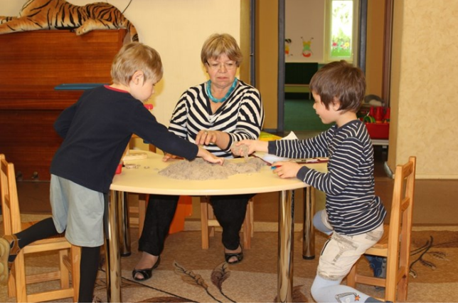
Pirmsskolas (Ana sınıfı)